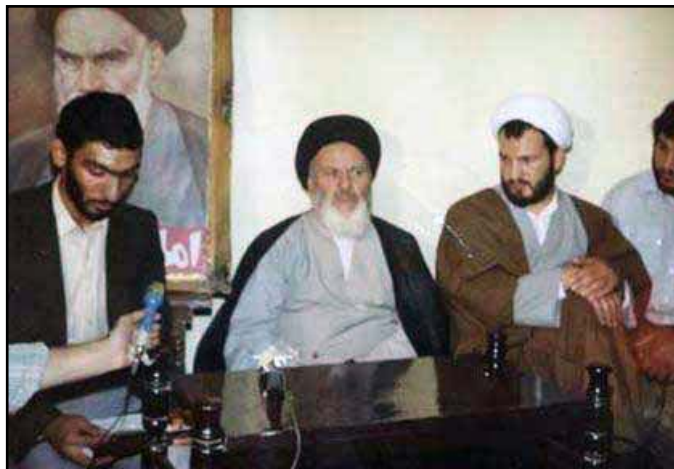
از راست به چپ: علی رازینی- سیدعبدالکریم موسوی اردبیلی- مصطفی پورمحمدی عکس مربوط به سال ۶۳-۱۳۶۲ در مشهد است. علی رازینی، حاکم شرع و مصطفی پورمحمدی دادستان انقلاب مشهد

در عکس زیر مصطفی پورمحمدی و علی رازینی هنگام تصدی پست‌های قضایی در مشهد دیده می‌شوند. این دو در سال ۶۳ به تهران منتقل شدند. پورمحمدی به وزارت اطلاعات پیوست و رازینی جایگزین لاجوردی در دادستانی انقلاب اسلامی مرکز شد.