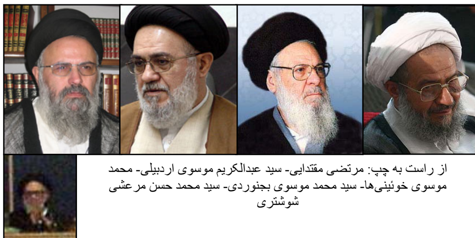
از راست به چپ: مرتضی مقتدایی - سید عبدالکریم موسوی اردبیلی - محمد موسوی خوئینی‌ها - سید محمد موسوی بجنوردی - سید محمد حسن مرعشی شوشتری